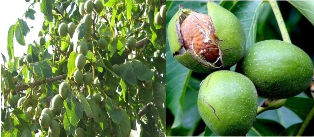
Şekil 3. 1. Şebin çeşidi meyve görüntüsü.

elverişlidir. İçi dolgun olup kabuktan kolay ayrılır. Tane ağırlığı 9,4 gr, iç ağırlığı 6,6gr, iç oranı %63'tür. İç yağ oranı %69 ve protein oranı %17'dir. Eylül ayı sonlarında hasat edilir. İyi bir meyve tutumu için tozlayıcı olarak Bilecik çeşidi kullanılmalıdır.