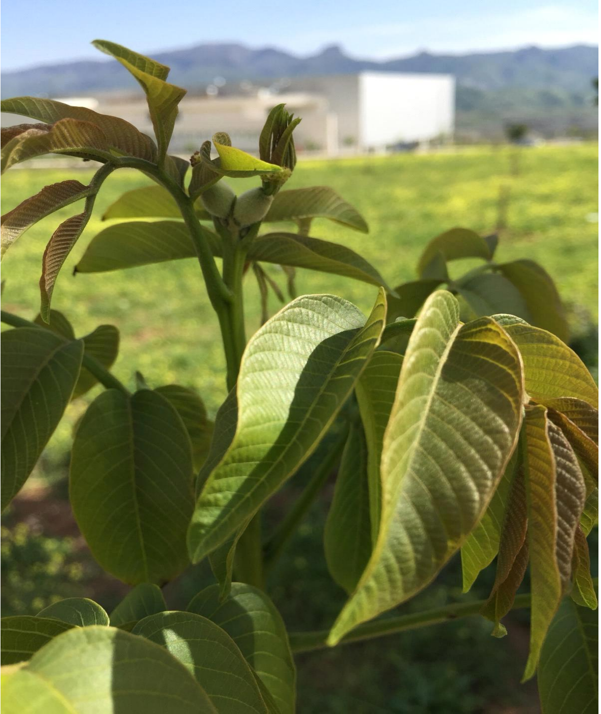
Şekil 5. 2. Üniversite Kampüsündeki Örnek Ceviz Bahçesinden Görüntüler. (Chandler Çeşidi)