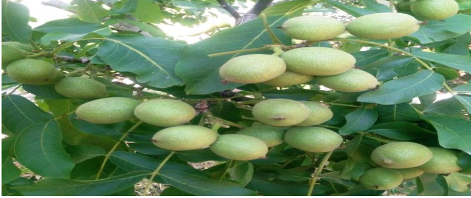
Şekil 3. 5.Fernor çeşidi meyve görüntüsü.