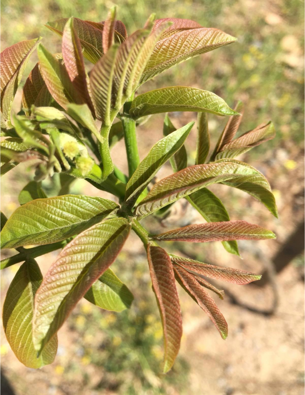
Şekil 5. 3.Üniversite Kampüsündeki Örnek Ceviz Bahçesinden Görüntüler. (Chandler Çeşidi)