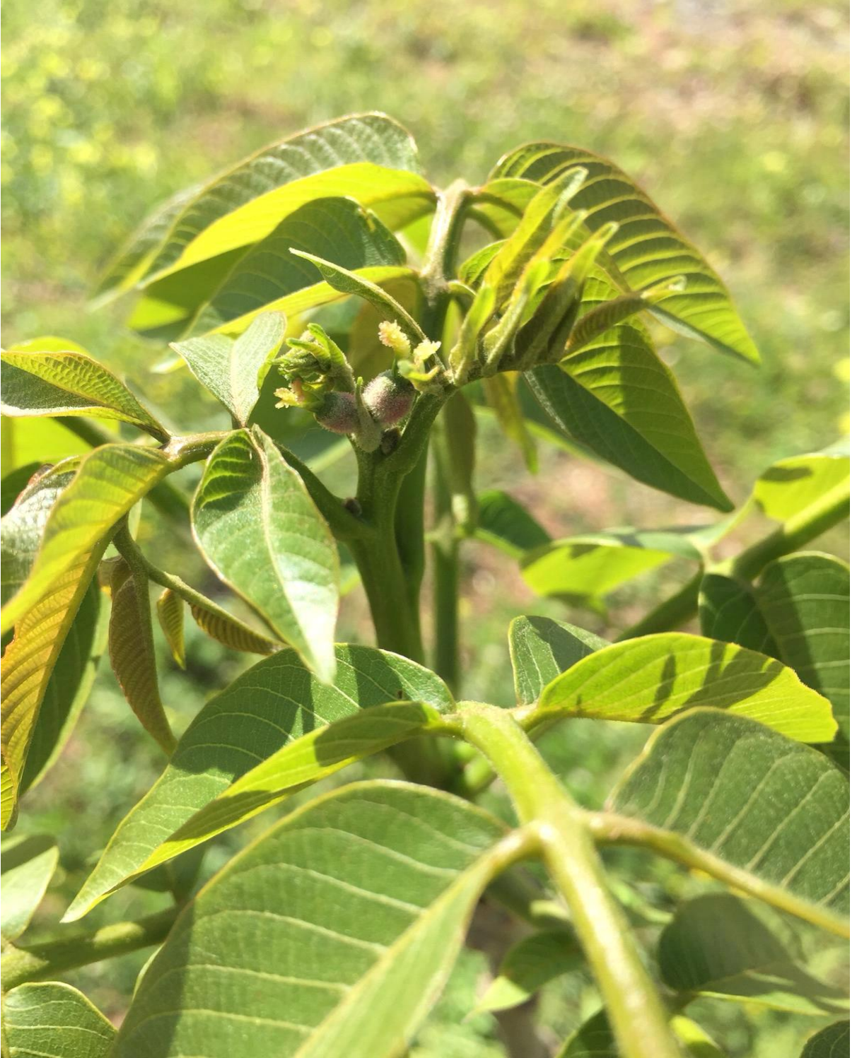
Şekil 5. 4. Üniversite Kampüsündeki Örnek Ceviz Bahçesinden Görüntüler. (Chandler Çeşidi)