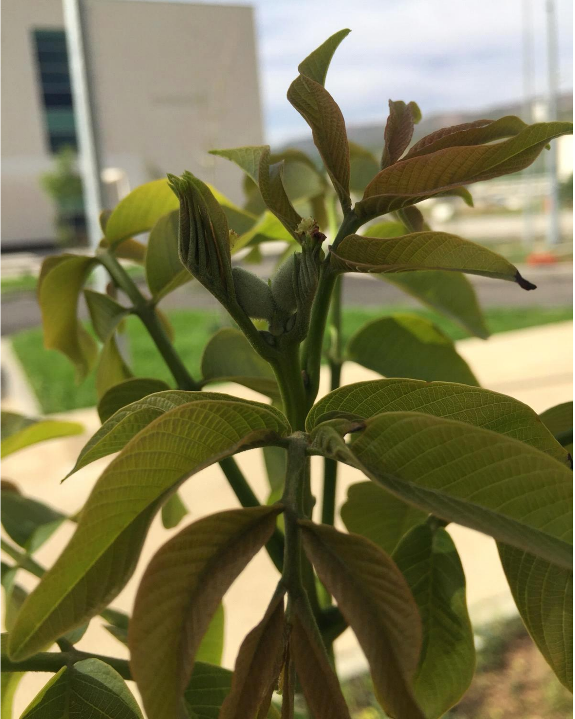
Şekil 5. 6. Üniversite Kampüsündeki Örnek Ceviz Bahçesinden Görüntüler. (Chandler Çeşidi)