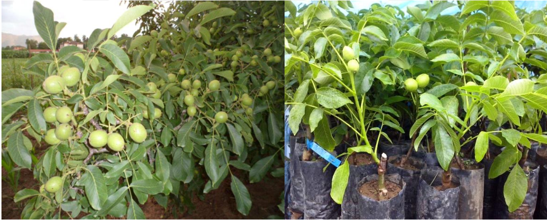
Şekil 3. 6.Chandler çeşidi meyve ve fidan görüntüsü.

Chandler ceviz çeşidi üstün verim özelliği ile tanınmaktadır. 1000 ve 1100 metre rakımlı yerlerde dikilebilmektedir. Sık dikime uygun bir yapısı vardır. Don olaylarından ve iklimsel sorunlardan pek etkilenmeyen Chandler cevizi Amerikan ceviz çeşidi olarak da ifade edilmektedir. Tozlayıcısı Franquette olarak ifade edilmektedir.