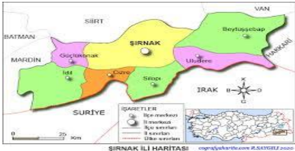
Şekil 1.2.Şırnak İl Haritası

Şırnak ili Güneydoğu Anadolu Bölgesi'nin Dicle bölümünde yer almaktadır. Diğer tarafında Doğu Anadolu Bölgesi sınırları içerisinde yer alan toplam alanı 7.172 kilometrekaredir. Şırnak ili hem Güneydoğu Anadolu Bölgesi hem de Doğu Anadolu Bölgesi'nde toprakları olan bir ildir. Batısında Mardin, kuzeyinde Siirt, kuzeydoğusunda Hakkâri illeri bulunmaktadır. Güney bölgesinde ise Irak ve Suriye yer almaktadır.