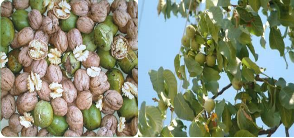
Şekil 3. 4. Kaman çeşidi meyve görüntüsü.

bilinmektedir. Her sene aynı oranda ürün vermesi nedeniyle verimi standarttır. Şekil olarak yuvarlak şekilli olduğu için kırma makineleri için uygundur. Eylül ayının sonlarına doğru hasat edilmektedir. Ortalama 16-gram ağırlığındadır. Yalova 3 cevizi ile tozlanarak dikimi yapılmaktadır. İç ağırlığı 7.7 g olup iç oranı %48 dir, ceviz yağ oranı %65'tir. Kaman cevizinin iç ceviz protein oranı %25 tir.