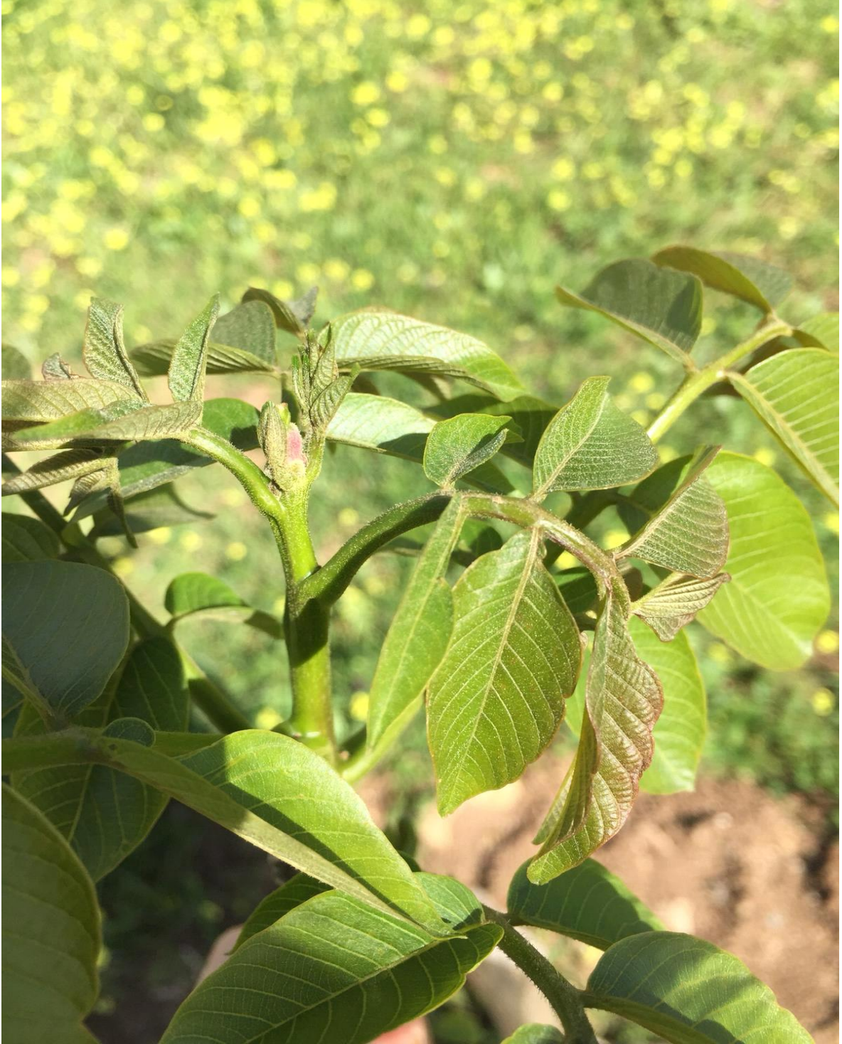
Şekil 5. 5. Üniversite Kampüsündeki Örnek Ceviz Bahçesinden Görüntüler. (Chandler Çeşidi)