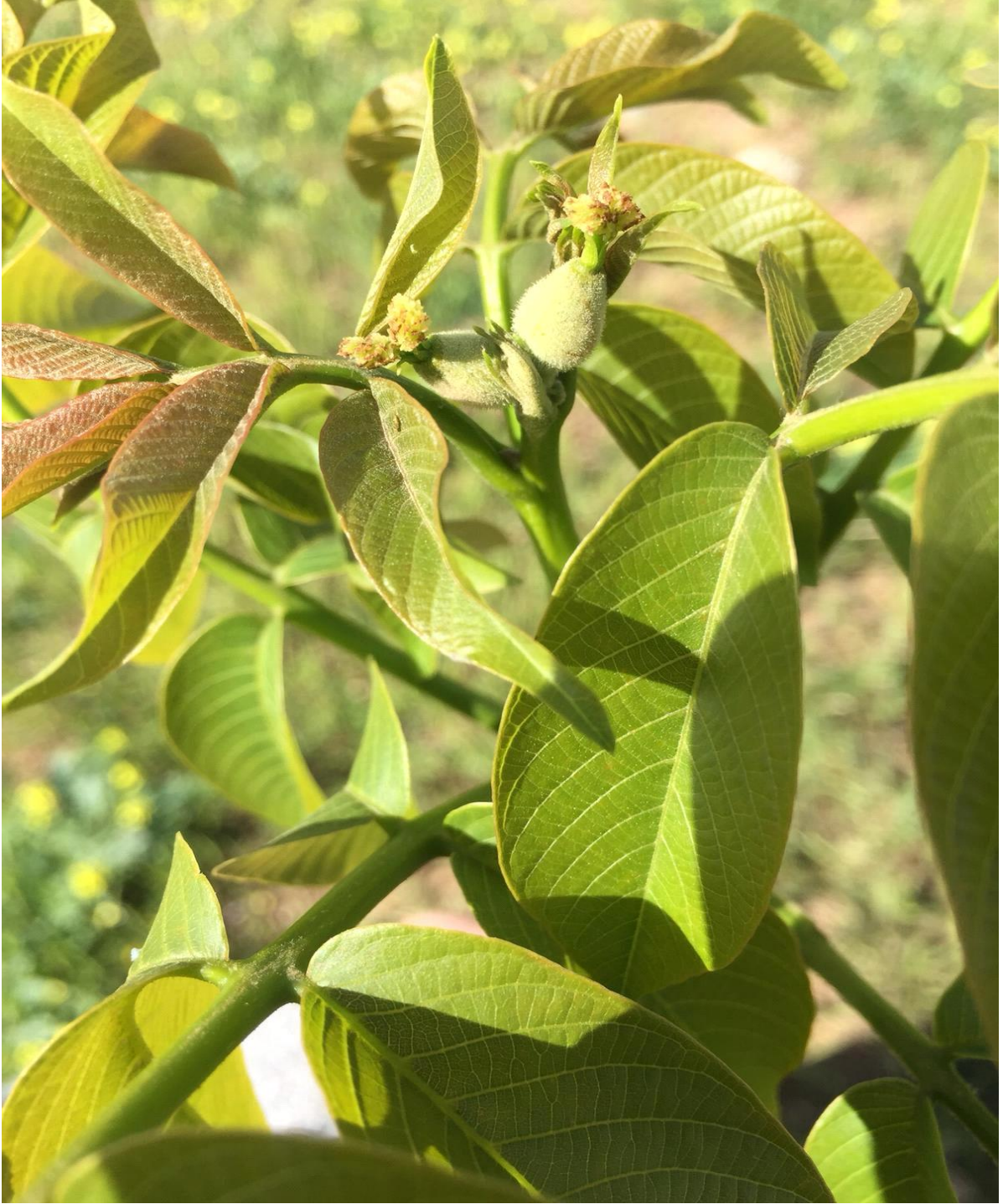
Şekil 5. 1. Üniversite Kampüsündeki Örnek Ceviz Bahçesinden Görüntüler. (Chandler Çeşidi)