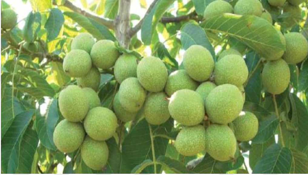
Şekil 1.1. Cevizin Genel Görünümü.

cevizin Amerika'ya götürülmüş olmasından kaynaklanmaktadır. Türkiye cevizin gen merkezi üzerindedir. Tohumdan yetişmiş ceviz populasyonları içinde geç yapraklanan, yan dallarda meyve veren, hastalık ve zararlılara toleranslı, verimli ve meyve kalitesi yönünden üstün özellikli yüzlerce tip bulunmaktadır (Haskınacı., 2003).