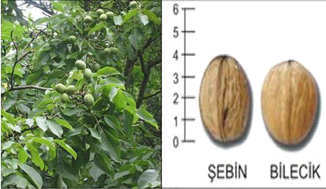
Şekil 3. 2. Bilecik çeşidi meyve görüntüsü.